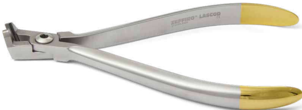
ZLH549 Mini tronchesino distale TC con trattenuta del filo, manico lungo - Mini distal and cutter TC with safety hold, long handle. ● Max 0.020" (0,51 mm) ■ Max 0.022"x0.028" (0,56x0,71 mm)