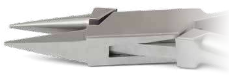
ZLH514 Pinza a becco d'uccello, punte lunghe, per laboratorio - Laboratory bird beak long plier Specifica per eseguire loop - Designed for loop forming. ● Max 0.018" (0,46 mm)