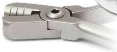
ZLH509 Pinza per formare e contornare archi stile De La Rosa - Arch forming and contouring plier De La Rosa style ● Max 0.016" (0,41mm); 0.018"(0,46mm); 0.022" (0,56mm)