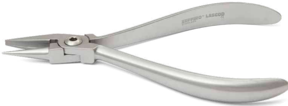
ZLH519 Pinza concava convessa - Round/concave plier ● Max 0.028" (0,71 mm)