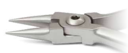
ZLH516 Pinze punte coniche per ganci, becchi lunghi - Rounded jaw wire bending pliers, long beak ● Max 0.020" (0,51 mm)