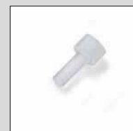
ZLH730 Accessorio per ZLH532 e ZLH533 Accessory for ZLH532 and ZLH533