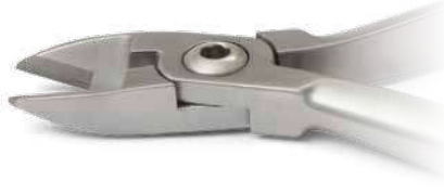
ZLH547 Mini tronchesino TC per legature, angolato 15° - Mini pin and ligature cutter TC, angulated 15°. ● Max 0.015" (0,38 mm).