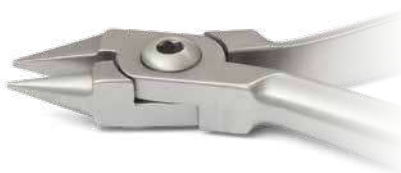
ZLH502 Pinza di Angle a becco d'uccello - Bird beak Angle plier ● Max 0.045" (1,14 mm)