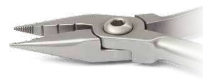
ZLH518 Pinza Jarabak - Jarabak plier Per curvare fili sottili e loop; a tre scanalature - To curve thin wires and loop forming. ● Max 0.020" (0,51mm)