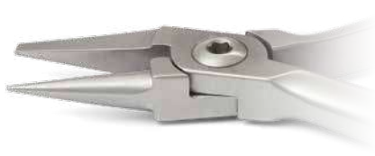
ZLH505 Pinza a becco d'uccello, punte lunghe - Bird beak long plier Per formare loop molto piccoli - For small loop forming. ● Max 0.016" (0,41mm)