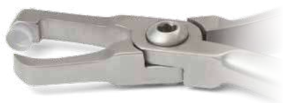
ZLH532 Pinza per rimozione bande posteriori, lunga - Posterior band removing long plier Con cuscinetto in plastica - Plastic pad