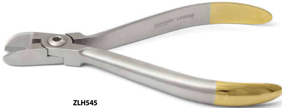
ZLH545 Tronchesino TC per legature, retto - Hard wire cutter TC, straight. ● Max 0.020" (0,51 mm) ■ Max 0.022"x0.028" (0,56x0,71 mm)