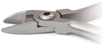
ZLH544 Mini tronchesino TC per legature, retto - Mini pin and ligature cutter TC, straight. ● Max 0.015" (0,38 mm).