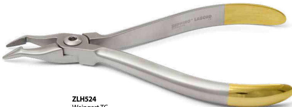
ZLH524 Weingart TC Con apporto in carburo di tungsteno - Tungsten carbide insert.