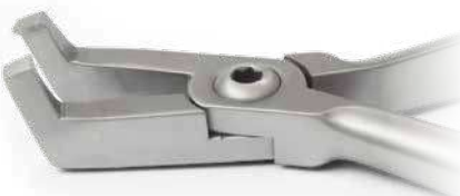
ZLH535 Pinza angolata per la rimozione attacchi D.B - Direct bond bracket removing angled plier.