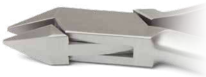
ZLH513 Pinza di Adams - Adams plier ● Max 0.036" (0,91 mm)