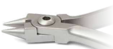
ZLH515 Pinze punte coniche per ganci, becchi corti - Rounded jaw wire bending pliers, short beak ● Max 0.029" (0,74 mm)