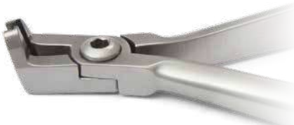
ZLH541 Mini tronchesino distale TC con trattenuta del filo - Mini distal and cutter TC with safety hold. ● Max 0.020" (0,51 mm) ■ Max 0.022"x0.028" (0,56x0,71 mm)