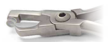
ZLH533 Pinza per rimozione bande posteriori, corta - Posterior band removing short plier Con cuscinetto in plastica - Plastic pad