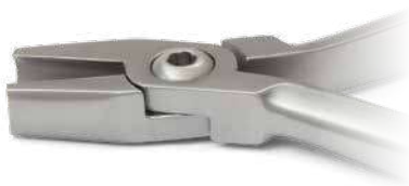
ZLH512 Pinza Hollow-Chop - Hollow-Chop plier Per formare e contornare archi, specifica per NICKEL TITANIO - To form and contour arches, designed for NICKEL TITANIUM