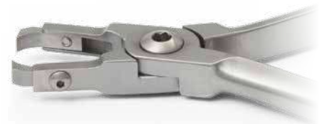
ZLH530 Pinza per rimozione attacchi D.B in acciaio e ceramica - Steel and ceramic D.B. bracket removing plier Estremità sostituibili - Replaceable ends