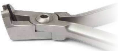
ZLH540 Tronchesino distale TC con trattenuta del filo - Distal and cutter TC with safety hold. ● Max 0.020" (0,51 mm) ■ Max 0.022"x0.028" (0,56x0,71 mm)