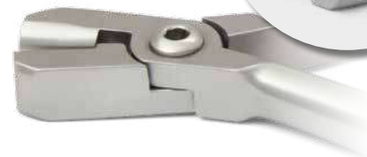
ZLH510 Pinza per formare archi, senza scanalature, stile De La Rosa - Arch forming plier, without groves, De La Rosa style.