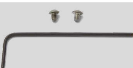
ZLH701 Accessori per ZLH530 Accessories for ZLH530