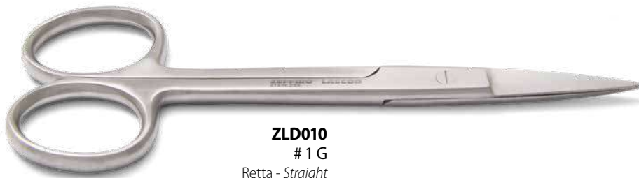
ZLD010 # 1 G Retta - Straight cm. 12