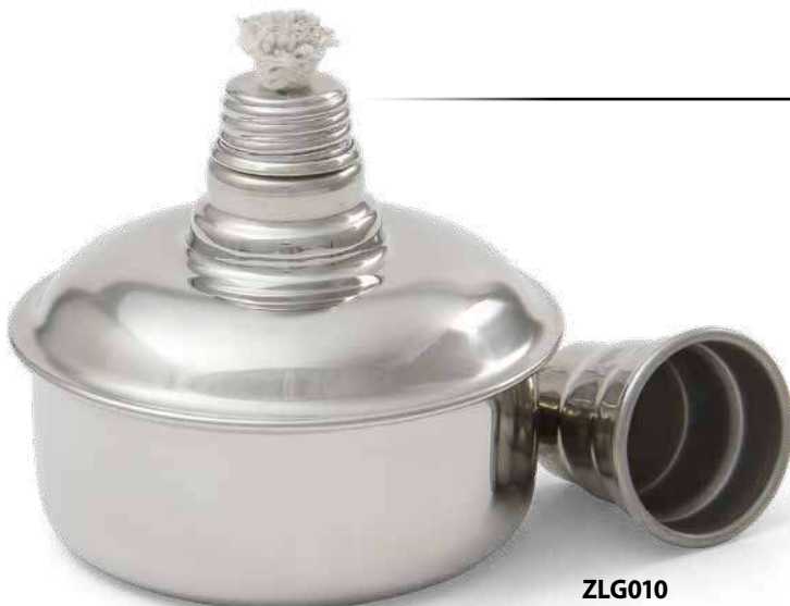
ZLG010 # LA