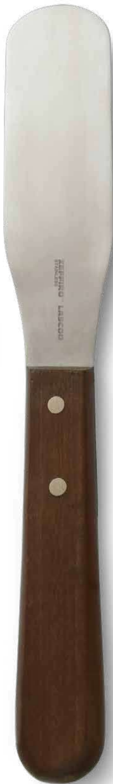
ZLC003 # 3 SA Flessibile - Flexible cm. 21,5