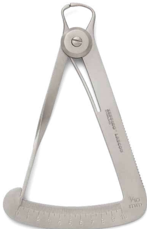
ZLL001 # IWW - Iwanson Per cera - For wax