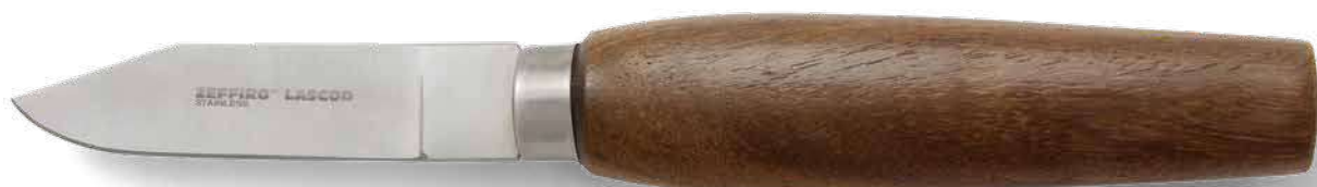
ZLB005 # 3 cm. 16