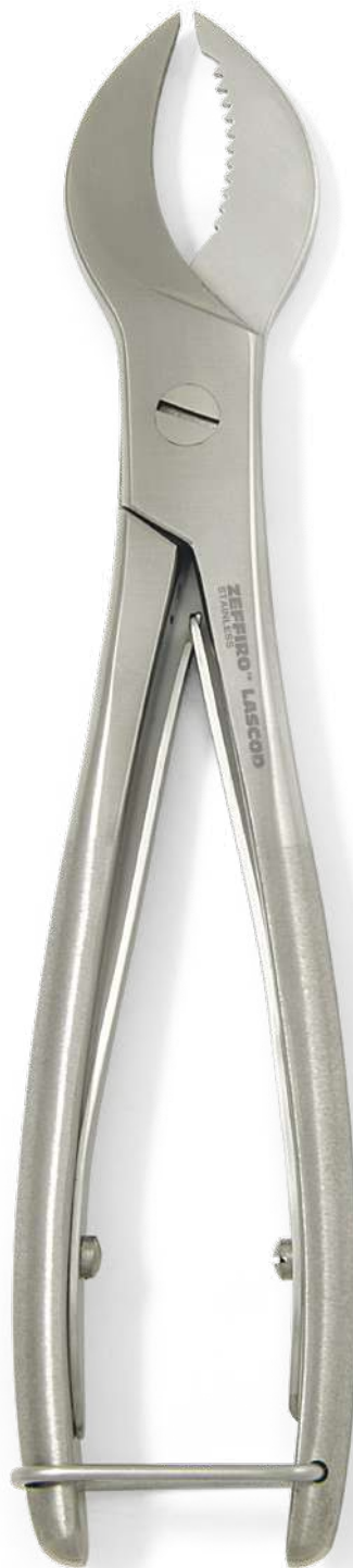
ZLG020 # PCP Pinza tagliagesso - Plaster cutting plier cm. 19