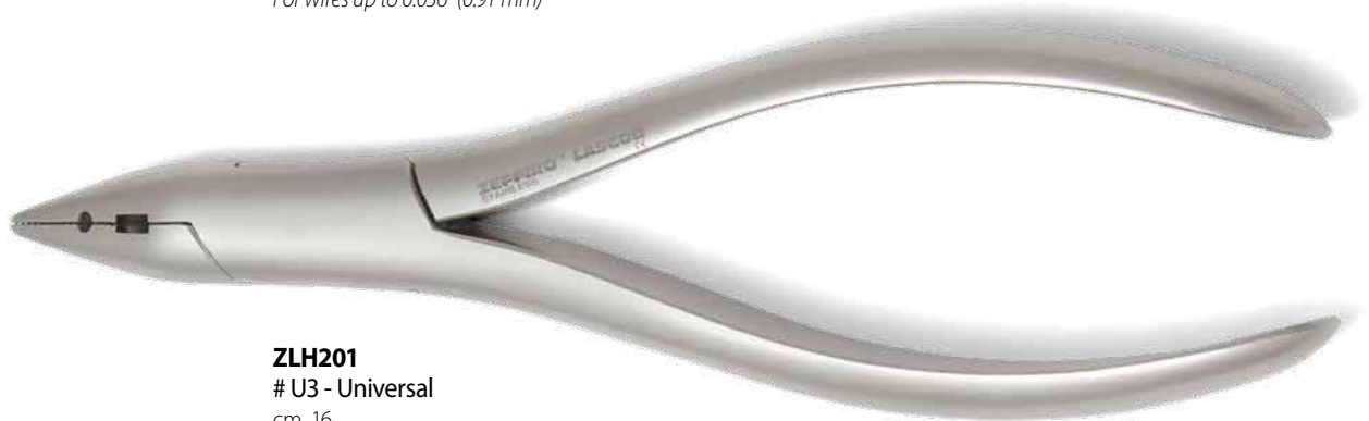
ZLH201 # U3 - Universal cm. 16 Per fili fino a 0,036" (0,91 mm) For wires up to 0.036" (0.91 mm)