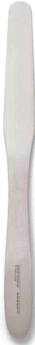
ZLC010 # 1 SS Flessibile - Flexible cm. 18,5