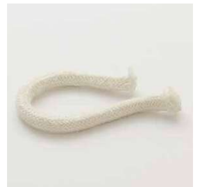
ZLG011 Stoppino di ricambio per lampada ad alcool Spare wicks for alcohol lamp