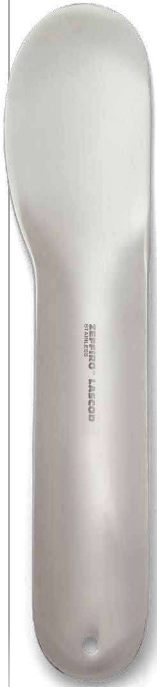
ZLC001 # 1 SA Rigida - Rigid cm. 18,5