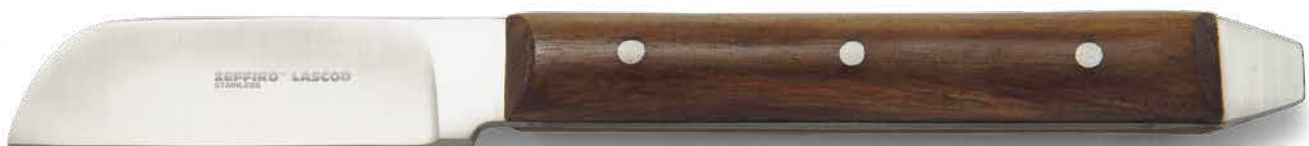
ZLB002 # GR - Gritzman cm. 17