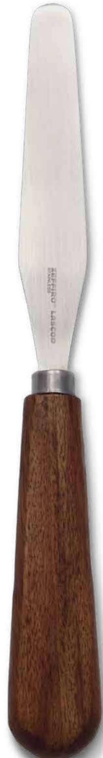
ZLC011 # 2 SS Flessibile - Flexible cm. 20,5