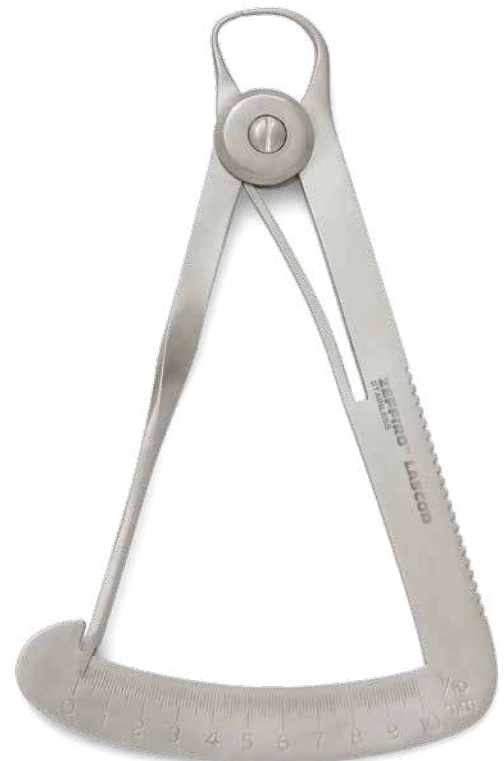
ZLL002 # IWM - Iwanson Per metallo - For metal