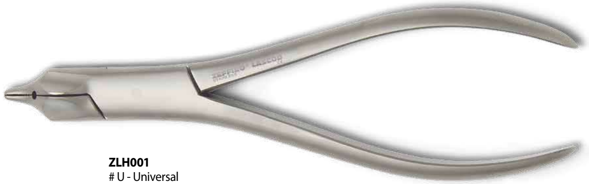
ZLH001 # U - Universal cm. 15 Per fili fino a 0,036" (0,91 mm) For wires up to 0.036" (0.91 mm)