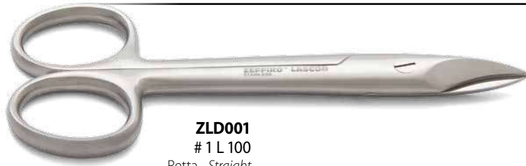
ZLD001 # 1 L 100 Retta - Straight cm. 10