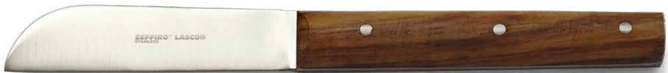
ZLB001 # PK 1 cm. 17